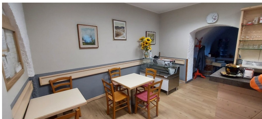
Locale principale con banco bar