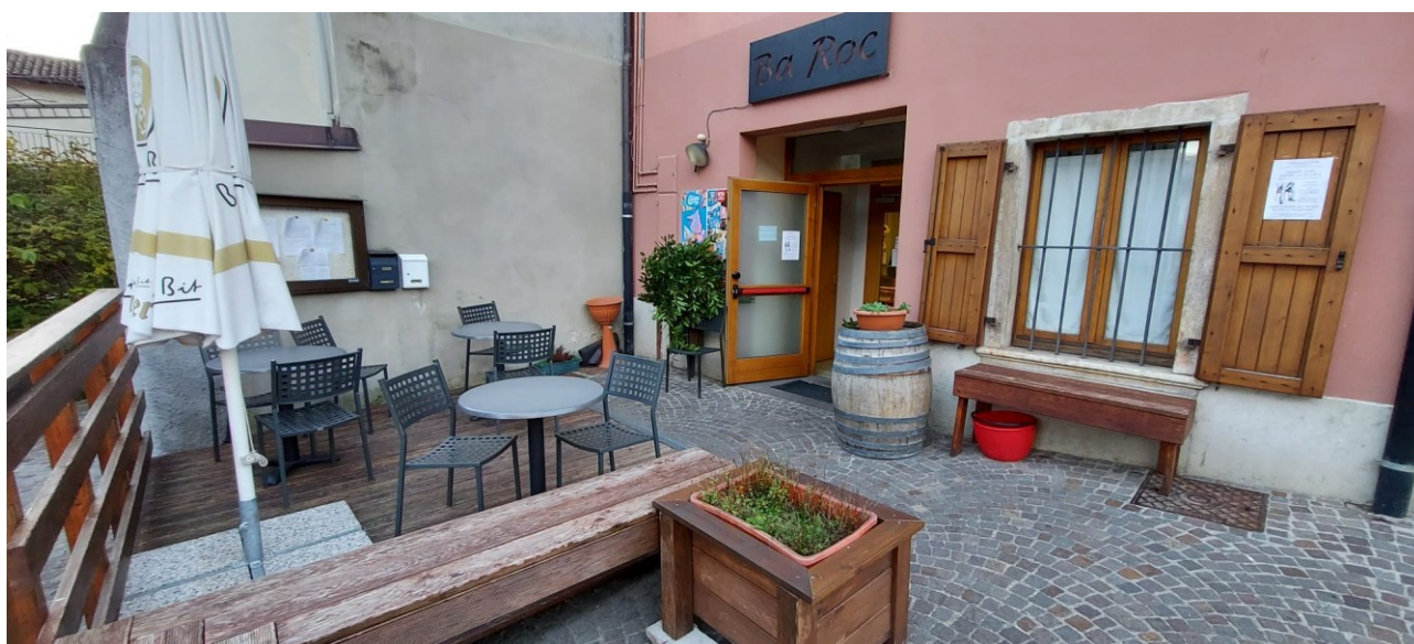
Ingresso del Bar con plateatico

Il contatore dell'acqua risulta essere unico per tutto il bar e si trova sotto il bancone del bar stesso.